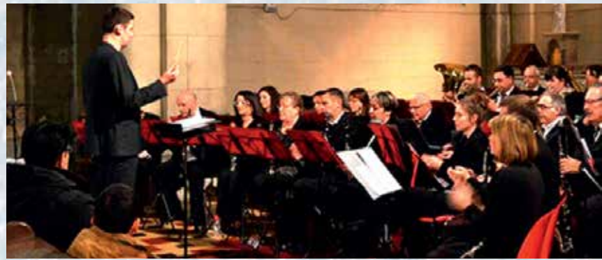
❄️ Concert de Ste Cécile à l'église St Vincent