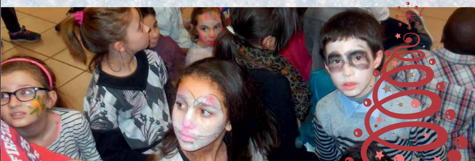
❄️ Au Centre de loisirs Dorldot

Pas moins de trente-cinq enfants âgés de 6 à 12 ans se sont vus proposés Une belle palette d'activités a été proposée à 35 enfants âgés de 6 à 12 ans : luge, piscine, escalade, activités manuelles : atelier cuisine et jeux de société.