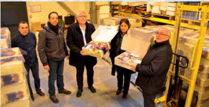
❄️ Distribution des colis aux personnes âgées