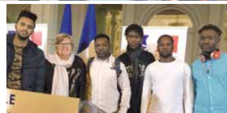
Les quatre demandeurs d'asile du Centre d'Accueil et d'Orientation de Louvroil ont obtenu le statut de réfugié après de la Préfecture, à Lille le 24 janvier.