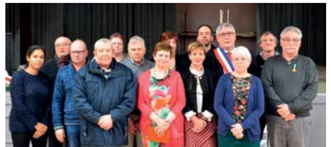
Les médaillés du personnel à l'occasion des vœux au maire, mercredi 11 janvier.

Si c'est la mienne c'est aussi la tienne elle vous déchaine c'est la Louvroilienne ”