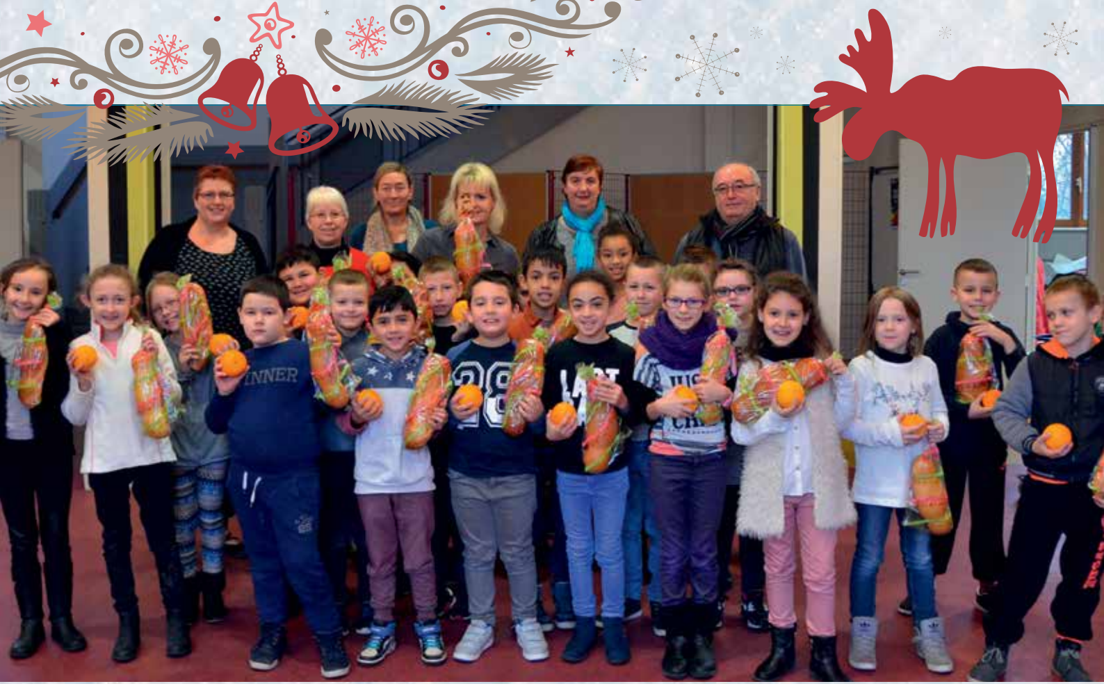
❄️ Tradition oblige, les cugnoles et les oranges pour tous les enfants Louvroiliens !